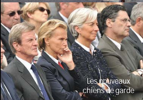
Les nouveaux chiens de garde