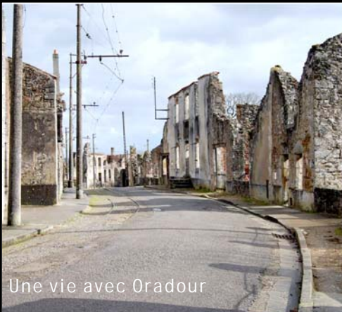
Une vie avec Oradour